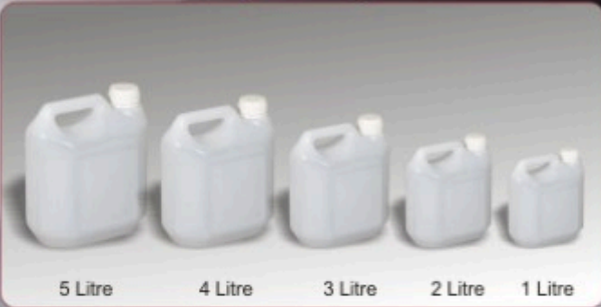
Kod TB 010