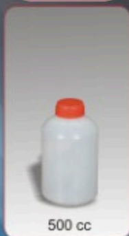
Kod TS 730