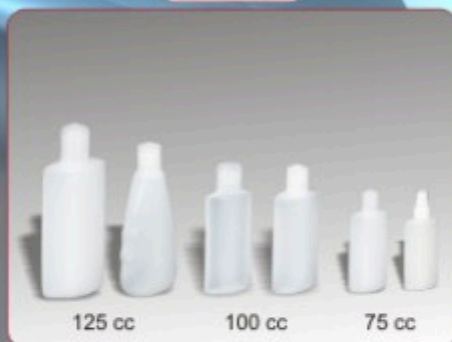
Kod TS 611