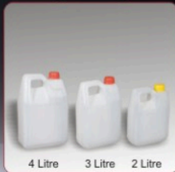
Kod TB 020