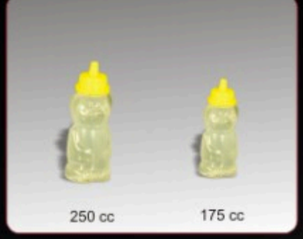
Kod TS 440