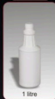
Kod TS 240