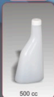
Kod TS 570