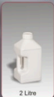
Kod TB 050