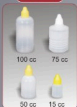
Kod TS 620