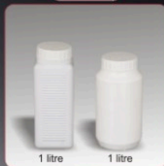
Kod TS 800