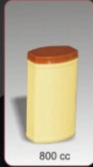
Kod TS 430