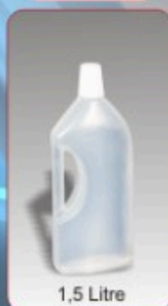
Kod TS 530