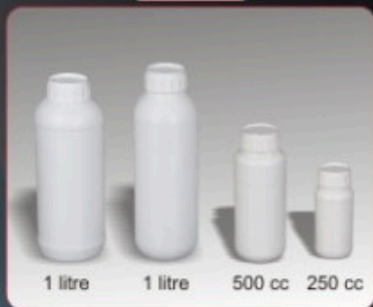
Kod TS 211