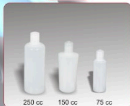
Kod TS 612