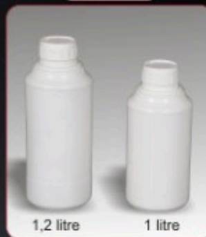
Kod TS 220