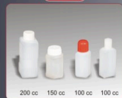
Kod TS 613