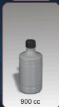
Kod TS 710