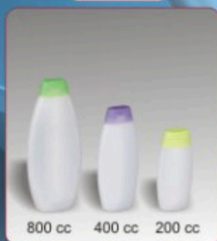
Kod TS 520