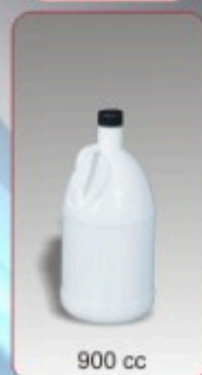
Kod TS 540