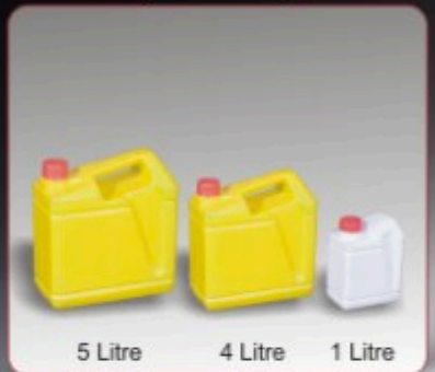
Kod TB 040