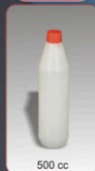
Kod TS 560