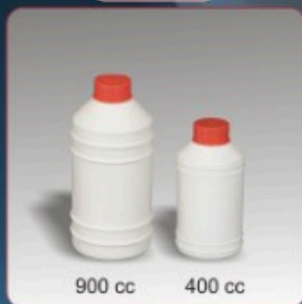
Kod TS 720