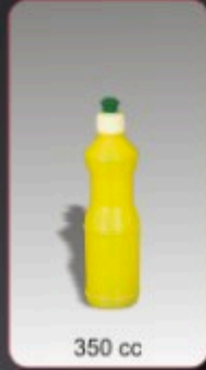
Kod TS 420