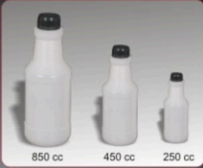
Kod TS 410