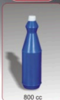
Kod TS 550