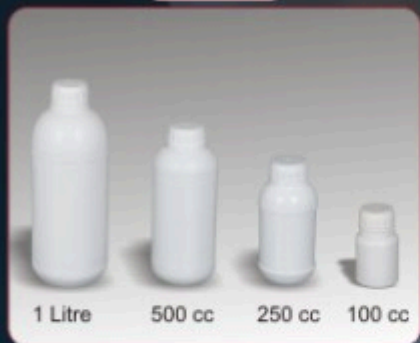
Kod TS 210