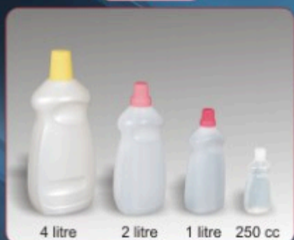
Kod TS 510